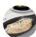
Ensaladilla rusa de langostinos Russian salad with prawn