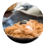
Fideos tostados con langostinos y alioli de piquillo y tinta de calamar Toasted noodles with prawns, piquillo pepper aioli and squid ink sauce