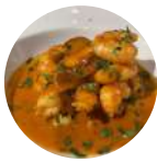
Langostinos al pil-pil Prawns to pil-pil style