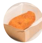
Croqueta Manueles "Manueles" Croquette