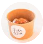
Albóndiga Manueles "Manueles" meatball