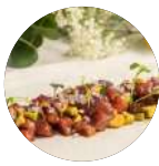
Tartar de atún rojo con aguacate Red tuna tartare with avocado