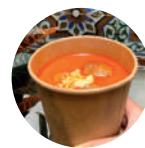
Salmorejo con picadillo de jamón y huevo Cold tomato soup with ham and eggs